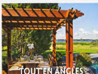
TOUT EN ANGLES